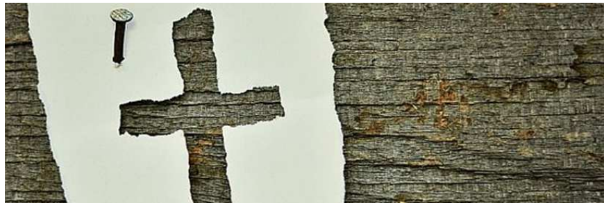
In der Fastenzeit beten wir jeden Freitag nach der 17.45-Uhr-Messe den Kreuzweg.